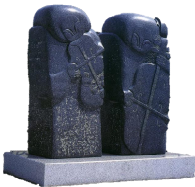
「響き」作: 吉本 豊

ヴァイオリンとチェロを持った二人。彼らの素晴らしい演奏に、そのハーモニーに耳を傾けてみてください。きっとあなたの心にゆとりと安らぎが訪れることと思います。