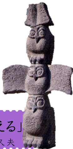
「あのね」作: 廣嶋 照道

糸電話で遊んだ遠い日のひとコマを捉え、おおらかで豊かな心が育つようにという願いを込めて作られた作品。